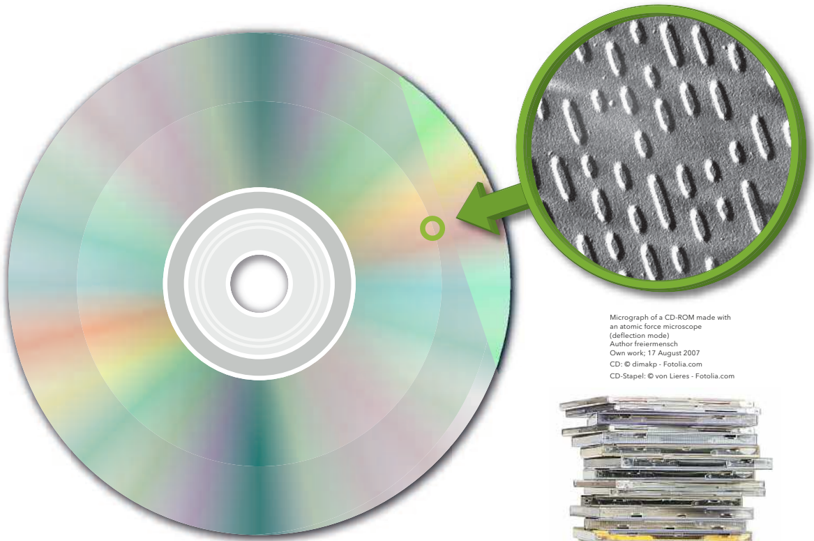
Micrograph of a CD-ROM made with an atomic force microscope (deflection mode) Author freiermensch Own work; 17 August 2007 CD: © dimakp - Fotolia.com CD-Stapel: © von Lieres - Fotolia.com

CDs auf unkonventionelle Weise retten und archivieren